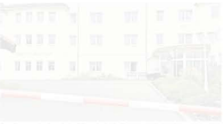
Der Corona-Ausbruch im Pflegeheim in Zempin weitet sich aus. Jetzt gilt für die gesamte Haus Quarantäne und Besucherverbot.

Die Refia-Klinik Ahlbeck hat ebenfalls weitere Fälle gemeldet. Die Zahl der Infizierten steigt weiter an.